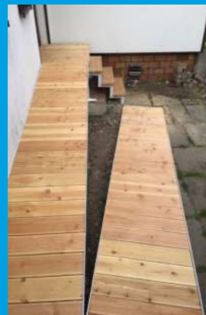
Auffahrrampen nach Ma