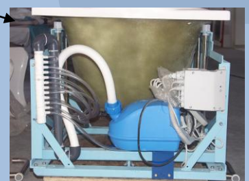
Whirlpoolsystem unter der Wanne